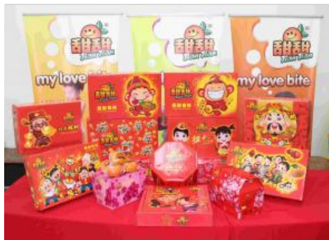
福猴年“甜甜”品牌年柑備有多種不同數量包裝，方便各界選購及送禮。